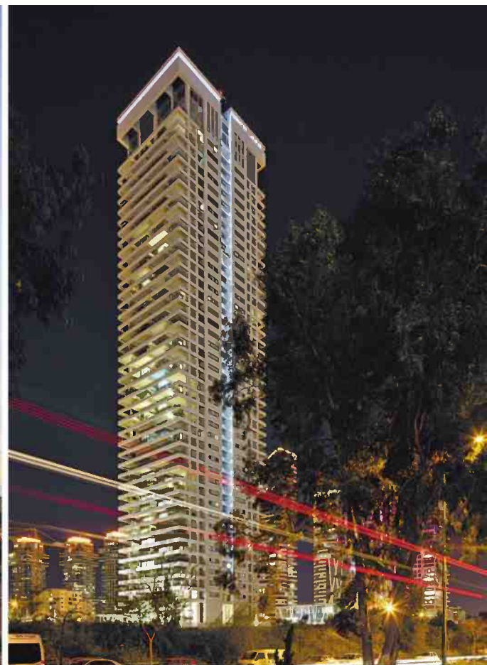
בניינים בתכנונו של אבנר ישר (מימין): מגדל W, מגדלי ToHa, הדמיה למגדל 120. בנייה לעשירים

פונץ'. הוא מספר שזו היתה המאפיה של אבא שלן, ונדמה שזה הבדל האחרון שעוד נשאר מא-ביו במשרד הזה.