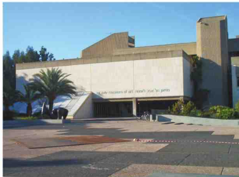
חזיאון תל אביב (מימין) ודיזינגוף סנטר, בניינים בתכנונו של האב יצחק ישר. התמונה במבני ציבורי

בווגיות וברור שאני לא רוצה שישו אותי לאף אחת, אבל אין לי בלבול בזה, מה המקום שלי במשפחה ומה אני שלמה איתו ומה מגיע מבחוץ. לפעמים זה מעצבן או חסר טקט, אבל וואלה בסדר". ישר ועיני עברו יחד לדירה שכורה במבנה באהאוס נמוך ברחוב קטן ושקט במתחם בול. "לא במגרד", מנדבת עיני את האינפורמציה המבקשת עוד לפני שנשאלה. "נכנסנו לדירה חדשה כי לא רצינו להסתובב בהרגשה שאני מצטרפת לו לחיים. רצינו להתחיל מהתחלה". הם התחננו בזמן הסגרה האירוע עצמו היה כמעט ספוגני. זה קרה בדירה שלהם בשכונת בול ונכחו רק החתן, הכלה, רב אחד ועוד אחד מאולתה. גם השמלה הלבנה והחופה היו מאולתרות. מיני מום דרמה. הדרמה הגדולה נשארה בחדרי המשך רד ברחוב טשרניחובסקי. ישר אומר שהוא שמח לעבוד עם אשתו ושאינו סיבה שהם יפרידו כר חות. "כל דבר שהוא אחר, קצת מאתגר. אבל זה לא אומר שזה רע או שצריך להיבהל". כמה במעריך החשיבה שלך נכנס השיקול של מה יגידו?